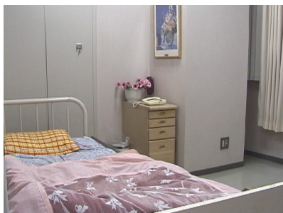
病室は当クリニックの2階にあり、すべて個室になっています。