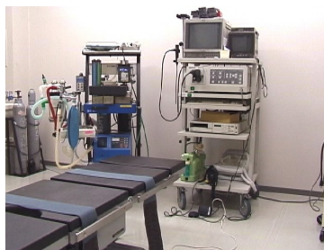
最新の設備を完備した手術室で手術を行います。