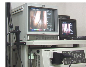
手術はCCDカメラモニタで観察・記録されます。

患者さんの麻酔が導入されると、患者さんの手術を行う部分の消毒を行い手術が始まります。手術は原則CCDカメラモニタによって記録いたします。手術時間は手術によって異なります。手術前の院長診察のときにおおよその時間をお伝えします。ご家族の方はお部屋でお待ち下さい。医学的にはご家族の付き添いは必要ありません。