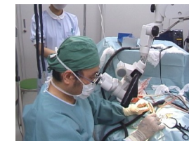
すべての手術を院長自らが行います。